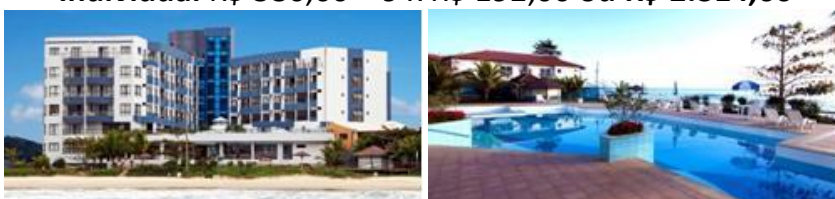
Este hotel fica no centro da Praia dos Ingleses.

Individual R$ 586,00 + 9 x R$ 192,00 ou R$ 2.314,00